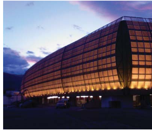
Denizli - Forum Çamlık Alışveriş ve Yaşam Merkezi - Mesh Uygulamaları