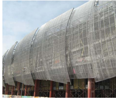
Forum İstanbul Alışveriş Merkezi