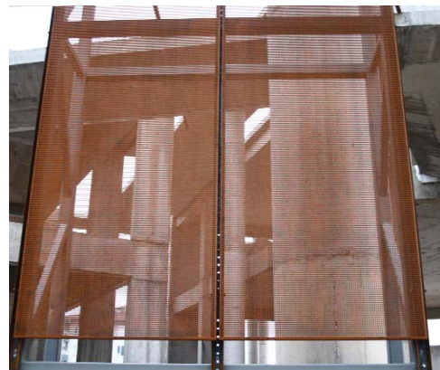
EAA Raif Dinçkök Kültür Merkezi - Corten A