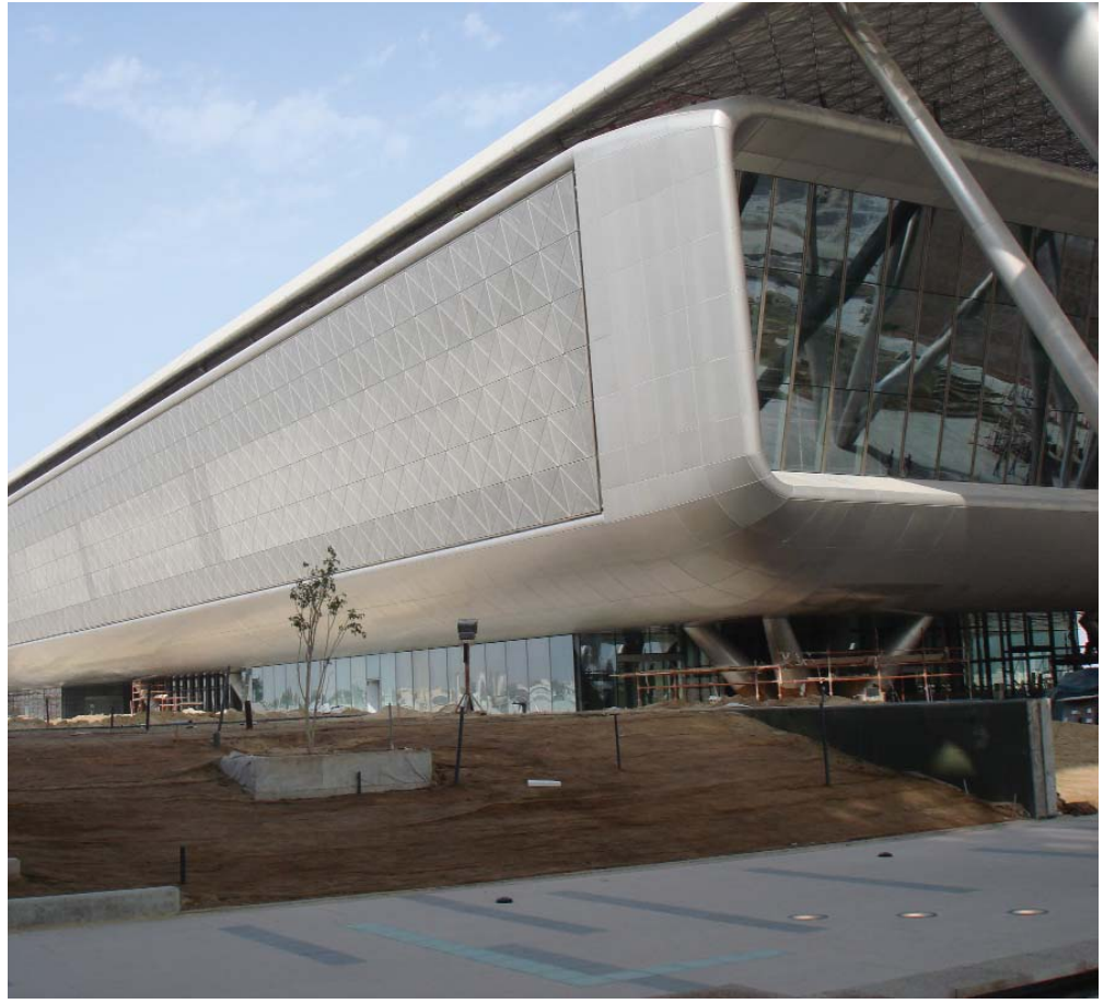
Katar Eğitim ve Teknoloji Kurumu, Çatı - Cephe Kaplama İmalatları